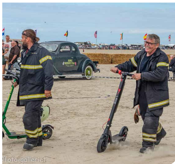
Alternativ transport til brandvagt.