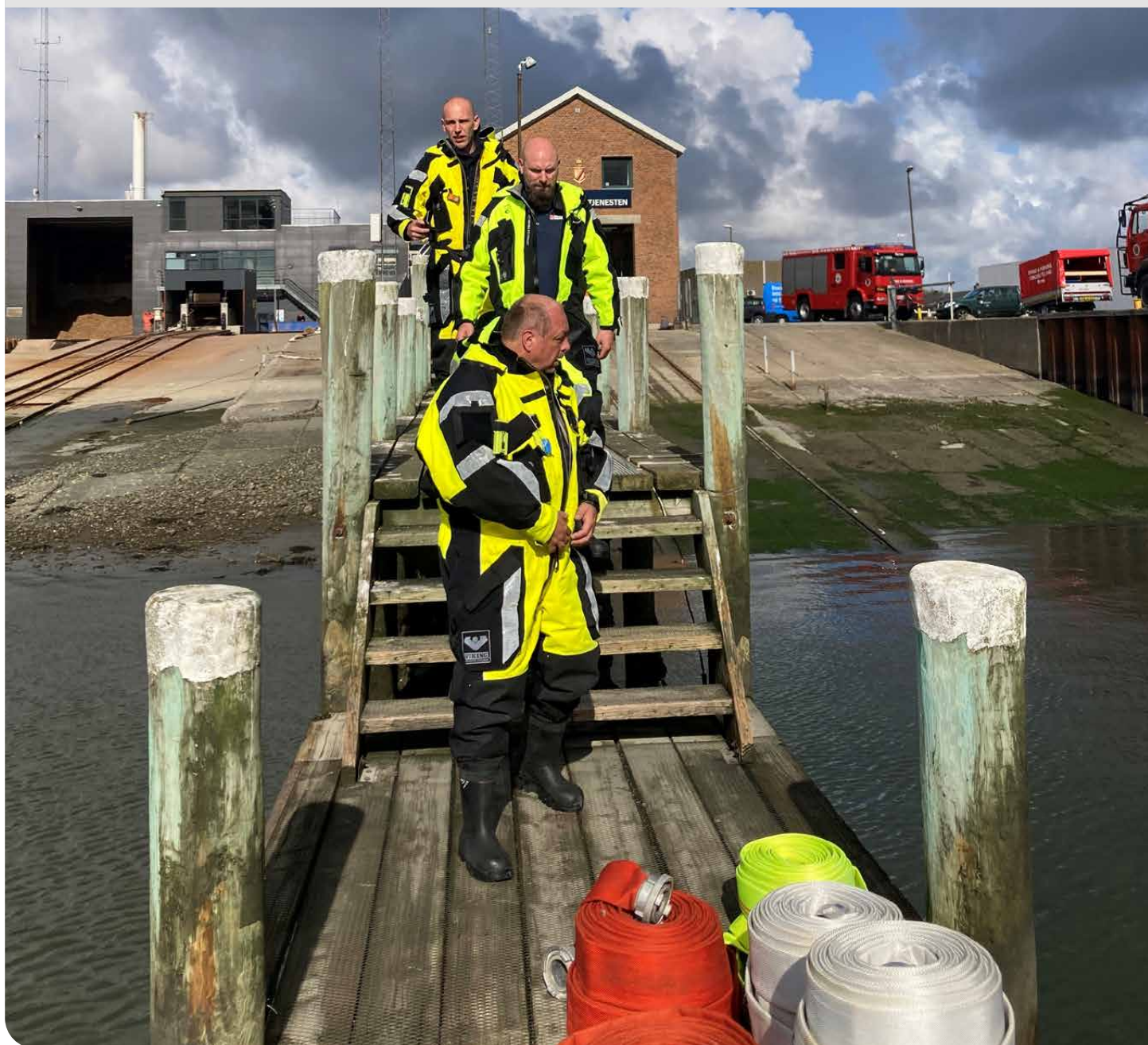
På vej til slukning på en brændende kutter.

Læs mere om Rømø Frivillige Brandværn på: www.facebook.com/112romo.dk